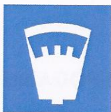
Rys. 5.2.50.2. Symbole stosowane na znaku D-44: