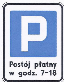
Rys. 5.2.50.1. Znak D-44

Znaki D-44 mają wymiary z grupy znaków dużych. Na znaku obok napisu „Postój płatny” wskazuje się sposób wnoszenia opłaty poprzez umieszczenie napisu lub symbolu parkometru, karty zegarowej, biletu itp. Jeżeli obowiązek wnoszenia opłaty dotyczy określonych dni lub godzin, pod napisem „Postój płatny” umieszcza się informację określającą zakres stosowania znaku. Symbole stosowane na znaku D-44 pokazano na rys. 5.2.50.2.